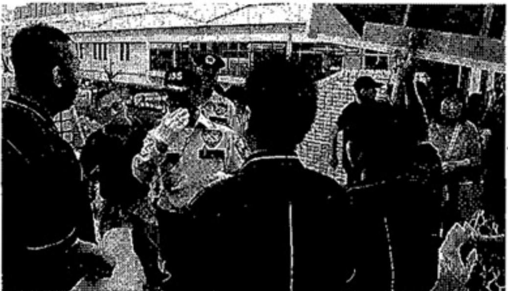
近隣住宅等と最終的な安全確認（お台場）